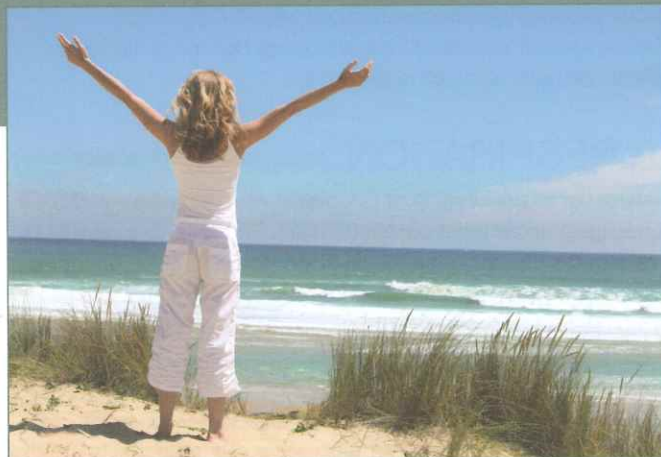
Libérée de la cigarette et des pollutions ?

J'ai 67 ans et je fume depuis l'âge de 20 ans, j'ai souvent eu le désir d'arrêter et j'ai essayé tous les artifices chimiques que la pharmacologie moderne a pu apporter sans aucun résultat. En essayant le Bol d'air®, je pensais d'abord à alimenter mon corps en oxygène ; mais au fur et à mesure de mes séances, mon envie de fumer s'est éteinte d'elle-même. J'arrive à ne fumer que les cigarettes qui me plaisent et ma consommation journalière a diminué de façon significative (je suis passé de 30 cigarettes à 10 par jour), sans efforts, sans prise de poids, sans effet de manque et, rien que pour cela, je continuerai à utiliser le Bol d'air Jacquier®. ”